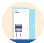
Douche de plain-pied